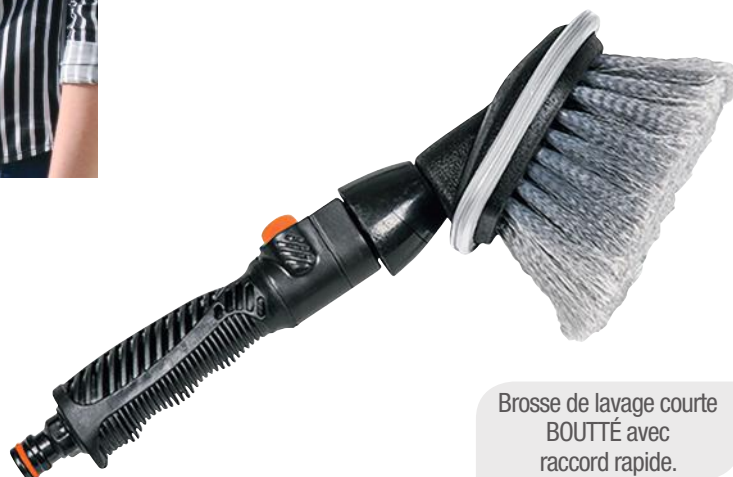
Brosse de lavage courte BOUTTÉ avec raccord rapide.

Avec des poils épais en fibres douces, la brosse courte BOUTTÉ garantit le nettoyage en douceur des surfaces sensibles d'une carrosserie, des jantes, vitres, etc.