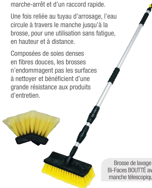
Brosse de lavage Bi-Faces BOUTTÉ avec manche télescopique.

Composées de soies denses en fibres douces, les brosses n'endommagent pas les surfaces à nettoyer et bénéficient d'une grande résistance aux produits d'entretien.