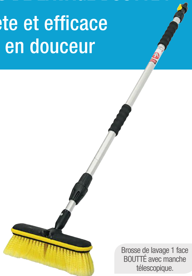
Brosse de lavage 1 face BOUTTÉ avec manche télescopique.