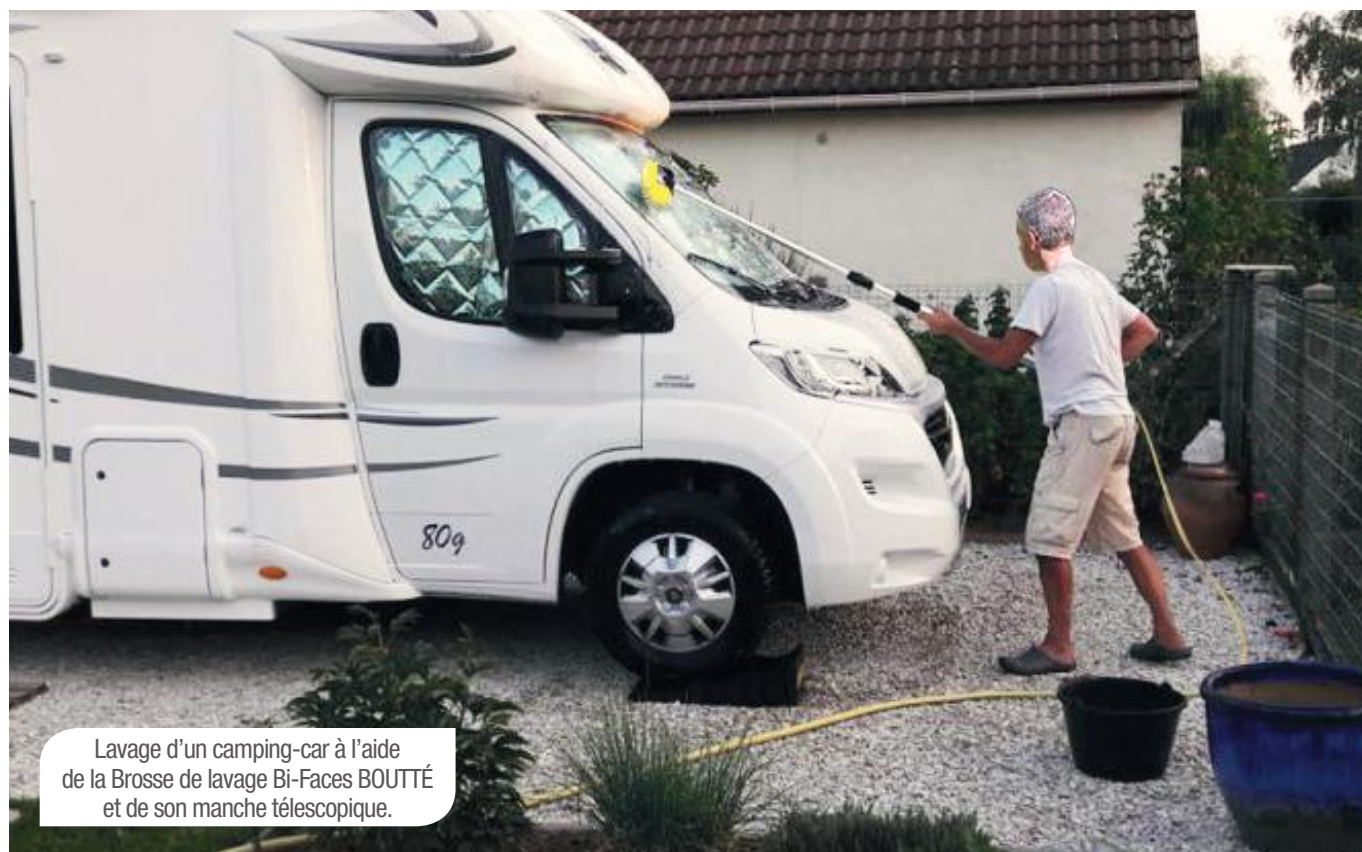
Lavage d'un camping-car à l'aide de la Brosse de lavage Bi-Faces BOUTTÉ et de son manche télescopique.

Les produits BOUTTÉ sont disponibles en Grandes et Moyennes Surfaces de Bricolage, jardinerie, libres-services agricoles, négoce, quincailleries et sur sites E-commerce.