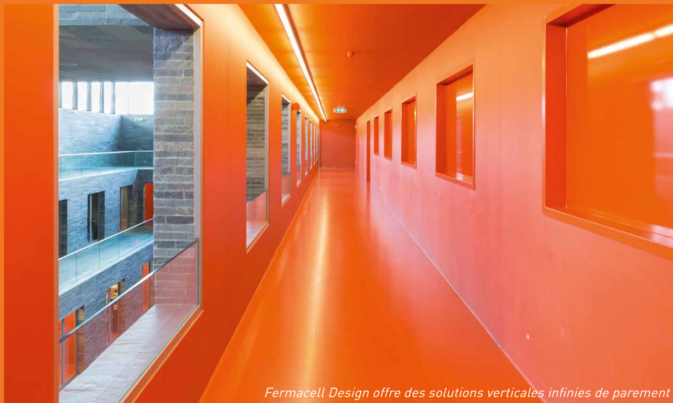
Fermacell Design offre des solutions verticales infinies de parement

Une nouvelle gamme de plaques de finition intérieure alliant résistance et esthétique sans limite