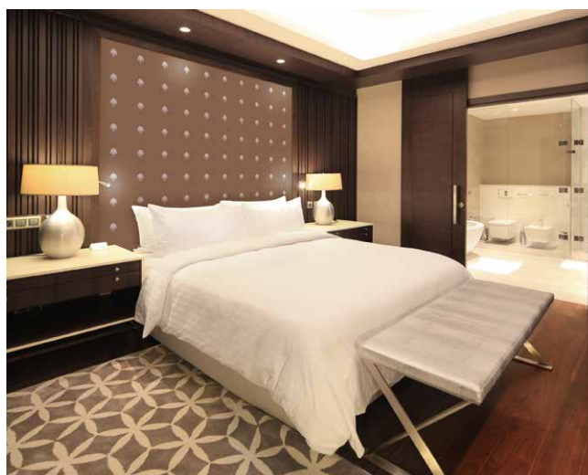
Hôtellerie : Fermacell Design, tête de lit sérigraphiée