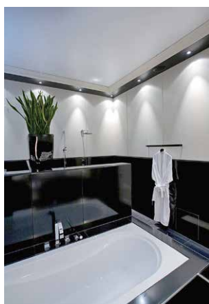
Résidentiel : Fermacell Design aspect brillant, insensible aux ambiances humides