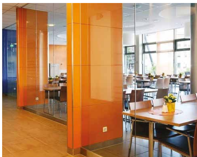
Aménagement de lieux publics : Fermacell Design aspect brillant