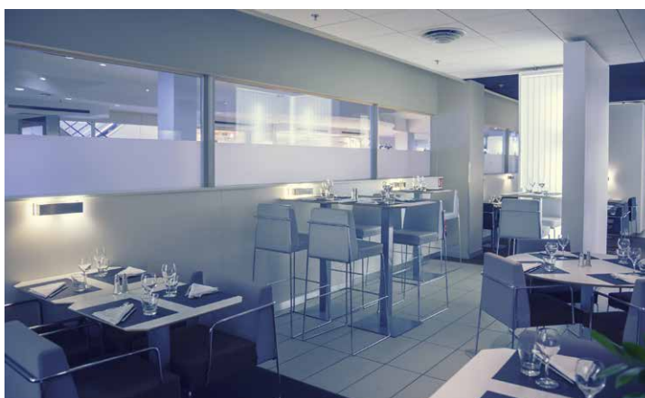
Restauration : Fermacell Design résiste aux nettoyages intensifs