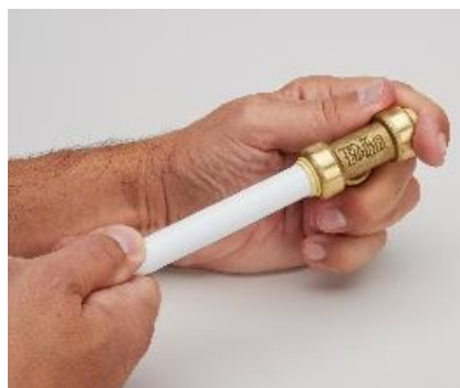
Introduction du raccord TOUTUB® dans un tube Multicouche

Pratique et solide, le raccord automatique TOUTUB® est simple et rapide à poser, quel que soit le diamètre à mettre en œuvre (12, 14, 16 ou 20 mm). Même installé, le tuyau reste libre en rotation, permettant une installation dans des endroits exigus. Avantage de cette solution, l'installateur n'a pas besoin d'un important matériel pour, par exemple, ajouter un robinet à un circuit existant ou créer une nouvelle installation. De plus, ces raccords automatiques se montent et se démontent sans outils et facilitent ainsi les futures évolutions d'un réseau d'eau.