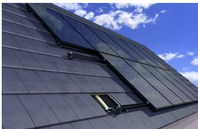
EASY ROOF TOP Surimposition sur toiture avec couverture tuiles plates